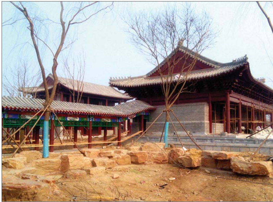
建设中的依绿园内景。

依绿园整体建筑风格采用传统园林建设手法,亭台廊榭、山石水桥,形态各异,疏密有致,集深厚文化内涵和清丽典雅的园林风景于一体。自然和谐,又充满着诗情画意,堪称园林建筑之精品。