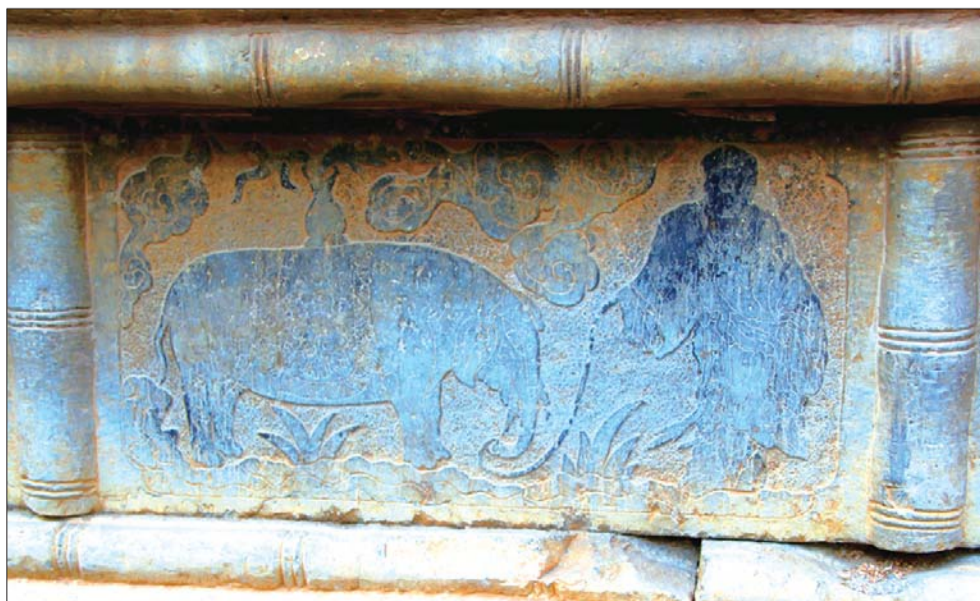
影壁底座中间位置的“大禹牵象躬耕于历山之下”的浮雕图。