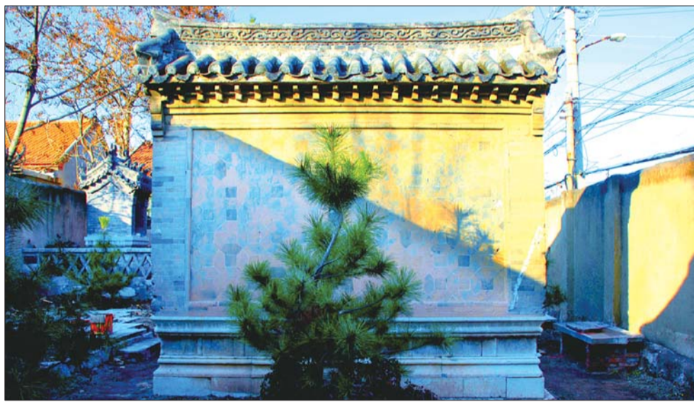
院内中间的精美影壁。