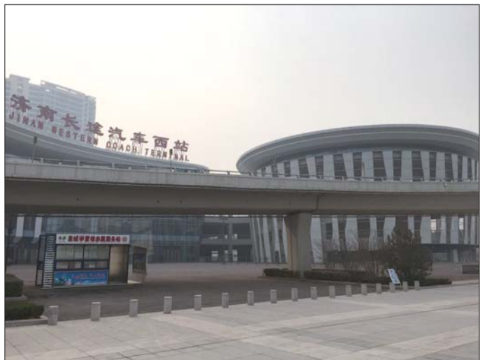
按照泉城特点,济南汽车西站设计成水滴造型。

目前,济南市民可乘坐19路、38路、K58路、K109路、K141路、K156路、K157路、K167路等公交车到达长途汽车西站,咨询或订票可拨打电话96966或0531-55804999。