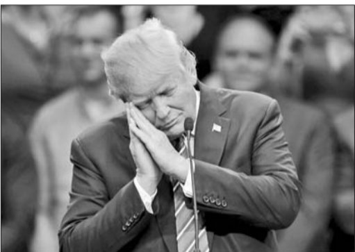
美国共和党总统竞选人、地产大亨特朗普。(资料片)

据新华社1月10日电 英国一名亿万富翁想在住宅下扩建地下室。这可不是一般的地下室,而是一个多层、庞大、豪华的地下空间,甚至还包括一个游泳池和标准草地网球场。这项大工程引来外交官邻居们的抗议,他们甚至援引国际公约,准备全力打一场“领土保卫战”。