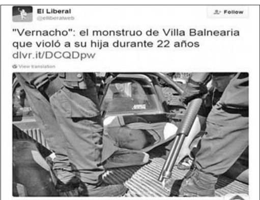
阿根廷《自由报》在社交网站公布的布利西奥被捕画面。