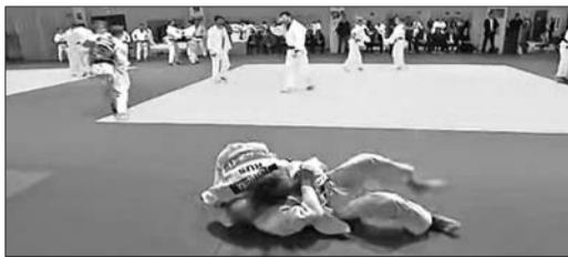
视频截图显示普京被女柔道运动员扎布鲁津娜撂倒。

据新华社1月10日电 美国民主党和共和党预选下月将拉开序幕,不少竞选人都在被视作“最早战场”的艾奥瓦州和新罕布什尔州奔波拉票,为节省时间而在这些州内的酒店过夜。然而,共和党内支持率领先的总统竞选人、地产大亨特朗普不在此列。媒体发现,特朗普不管出席哪里的竞选活动,几乎每天都坚持乘专机返回纽约的豪宅中过夜。