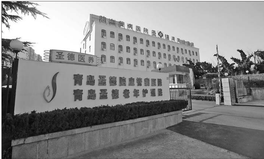
青岛圣德老年护理院。