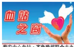
泰安中心血站·齐鲁晚报联合主办

21日下午,下港镇卫生院职工在岱岳区卫计委及镇卫生院委的组织下参加了无偿献血活动。在本次无偿献血活动中,广大医务工作者积极参与,共有25人经查体符合献血条件并成功献出血液。虽是严冬,但每个人脸上都洋溢着笑容,为无偿献血事业做出了奉献。