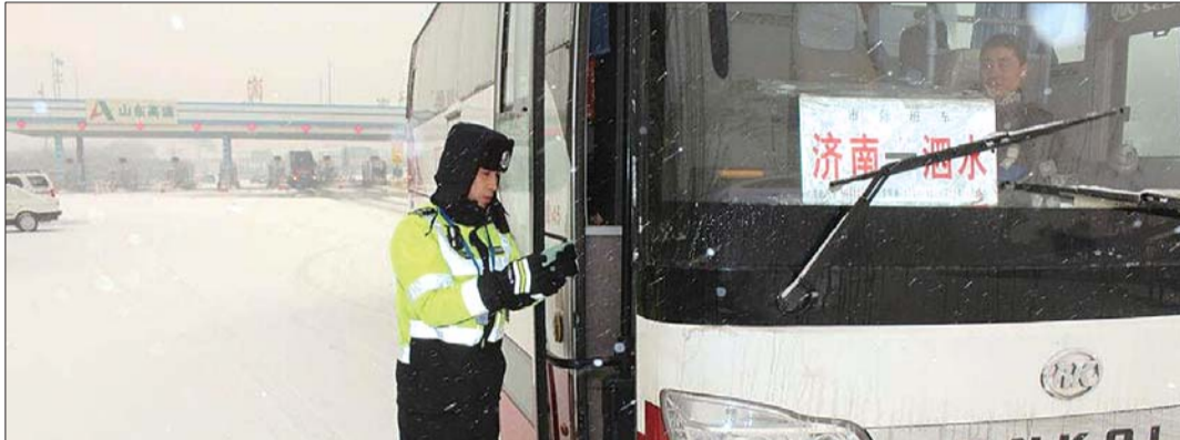
交警冒雪执勤,检查客运班车。

本报1月31日讯(记者 张帅) 2016年春运已于1月24日开始,历时40天。记者从交警部门获悉,为做好春运交通安全管理,预防重特大道路交通事故,长清交警大队将按照“双七”行动整治部署,加强辖区交通隐患大排查,集中开展道路整治行动,强化部门联动,提升交通应急处置能力,确保春节期间市民出行安全。