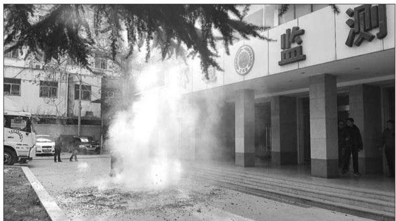
在鞭炮燃放实验中,周边空气质量瞬间变差。

本报济南2月3日讯(记者 刘德峰) 燃放烟花爆竹对环境究竟有多大影响?3日下午,济南市环境监测中心站在院内进行了测试。监测数据显示,一挂2000响的鞭炮燃放后,院内空气中的PM2.5浓度迅速飙升了100余倍。