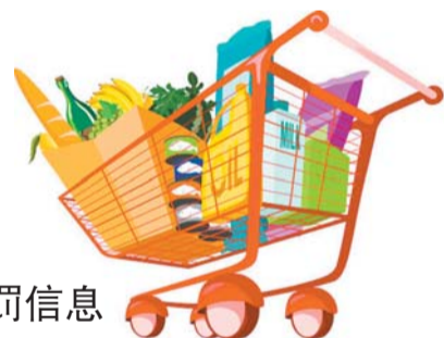
1月食药行政处罚信息

本报2月3日讯(记者 王皇 实习生 郭婉莹) 3日,1月第二批食药行政处罚信息出炉。槐荫区、历下区、历城区、章丘市纷纷公布了辖区内食药案件的处罚情况。