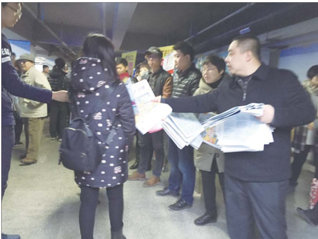
17日,在张店区人力资源市场,各企业招聘人员抢着向一名应聘者递上招聘简章。16日,淄博2016年春风行动拉开帷幕,17日,近百家单位在张店区人力资源市场“招兵买马”,服务业用工需求大,一线技术工、促销人员需求旺盛。此后一个月内,全市各人力资源市场、人才市场将举办40余场招聘会,800多家企业提供2.3万个岗位。