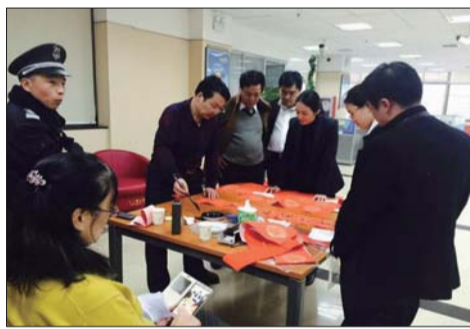
▲临淄营业部客户亲自上阵