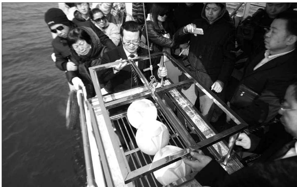
2015年4月,在青岛市组织的一次海葬活动中,丧属和工作人员一起将逝者的骨灰沉入海底。(资料片)