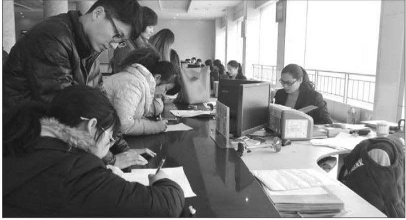
交易大厅内,办理二手房手续的市民有所增多。

减税政策实施两周多,济宁的二手房市场出现短暂的回暖。济宁市房产交易中心的统计数据显示,二手房成交量同比增130%,以学区房成交为主。业内人士分析说,目前房屋交易减税新政实施的时间尚短,难以用楼市的反应来定论所带来的真正影响,市场的真正反应仍然需要等待时日。