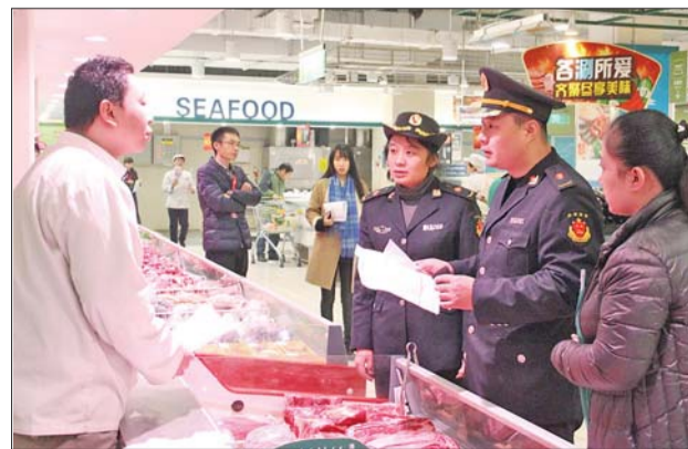
济南高新区市场监管局执法人员检查肉食品安全。

截至目前,整治行动相继出动执法人员358人次,出动执法车辆139车次,检查规范生产经营业户174户次,公示《关于规范羊肉及其制品屠宰和生产经营行为的通告》84份,对于落实索证索票和进货查验制度不到位的业户下达了责令限期整改并予以警告。通过整治工作,进一步规范了高新区羊肉经营户的经营行为,确保广大人民群众吃上“放心肉”。