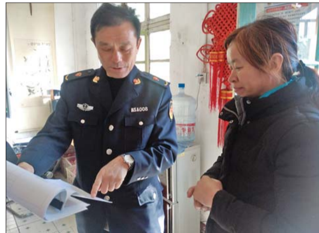
执法人员进行食堂专项检查。