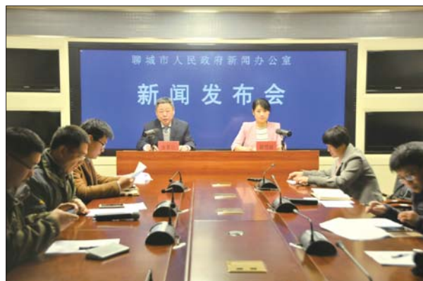
在10日召开的市政府例行新闻发布会上,林业部门发布植树倡议。

要宣传和践行植绿护绿、爱护环境、善待自然、节约资源的理念和生活方式,用自己的实际行动宣传植树造林和城市