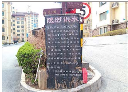
山水庭苑小区里的限水通知。