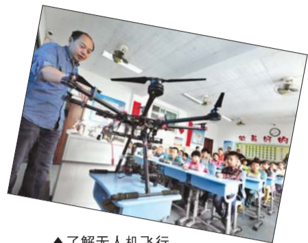
▲了解无人机飞行。

“小记者还要面试,应该怎么准备呢?”为了对孩子进行前期考察,一至二年级的孩子可以录制一段视频,展现孩子的特长和天赋。三年级以上的孩子需提交作文一篇,借此检验孩子的文字功底,并在后期的活动中进行针对性的指导。相关作品请发送到邮箱357751414@qq.com。