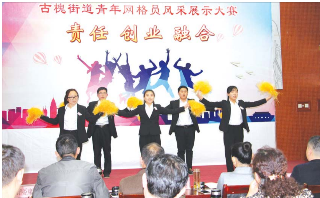
►青年网格员在跳健身操。

本报济宁3月30日讯(本报记者 范少伟 通讯员 刘露) 为深入推进网格化管理工作,激励基层网格员拼搏进取、创先争优的精神,3月21日下午,古槐街道开展“责任、创业、融合”青年网格员风采展示大赛。歌典、朗诵、小品等精彩的节目彰显了基层网格员的情怀和风采,传递了满满的正能量。