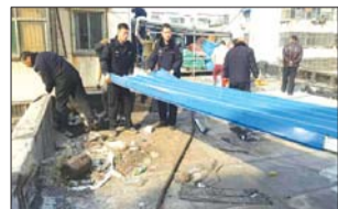
古槐大队拆除违章建筑

3月1日下午,综合执法古槐大队对草桥口文胜街一违章建筑进行强制拆除。2月14日接人民群众举报,草桥口文胜街一店主,在未取得建设工程规划许可证的情况下,擅自搭建板房,并且影响周围群众的生活。执法人员到达现场后,出示证件表明身份并告知其违反《中华人民共和国城乡规划法》第四十条第一款,依据《中华人民共和国城乡规划法》第六十四条,向其下达责令改正通知书,限期三日自行拆除。然而该业主未在规定时间内落实,大队及时组织人员,周密部署,齐心协力,顺利拆除违章建筑90平方米。