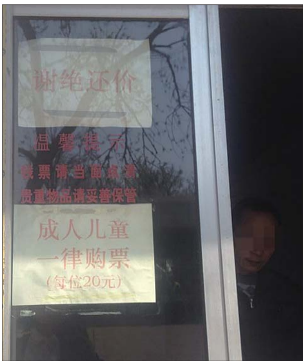
泉城公园儿童乐园的售票处贴着“成人和儿童一律20元”。