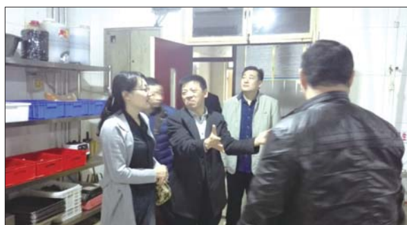
食药监局检查英才学院食堂。

检查情况显示,今年山东英才学院(北校区)食堂的硬件条件改善较大,卫生情况较好,操作流程比较规范,用餐舒适感明显提升。执法人员对食堂负责人进一步提出要求,春季是传染病高发季节,要始终把食品安全放在各项工作的第一位,杜绝食品安全隐患的发生,让校园食堂更好地为学生服务。