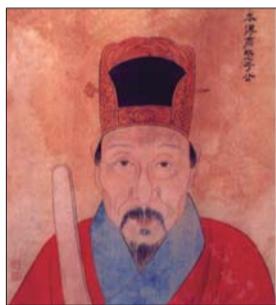
明朝名臣、民族英雄于谦。镇国将军刘通长孙刘鑑曾随侍于谦左右。

刘鑑，镇国将军刘通之长孙，怀远将军刘裕之长子。曾任后军都督府都督。今光岳楼一层南面东数第二幢石碑，是明成化二十二年(1468)《重修东昌楼记》碑，碑阴修楼者题名“后府都督弟、恩赐八十散官刘山。”这里的“刘山”就是刘鑑之弟，后府都督指的就是刘鑑。