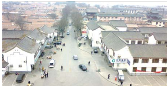
拍摄于二十世纪九十年代的古城楼南大街。右下角为明代刘通故宅遗址处。

僧格林沁死后，同治皇帝谕旨，命在他所转战的地方建忠王祠，东昌府的“忠王僧王祠”就建在了楼南大街路西，刘府的南部被僧王祠占用。民国初，以无主财产归公，与邻近的公房办了光岳楼女子小学。抗战胜利后，聊城县孤儿院设此。解放后，人民银行聊城中心支行设在这里。今圣旨博物馆以南，海源阁宾馆以北就是明清时期的原刘氏故宅所在地。