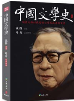
《中国文学史》 钱穆 讲授 叶龙 整理 天地出版社 2016年3月版

好的文学作品必须具备纯真与自然。真是指讲真理，讲真情。鸟鸣兽啼是自然的，雄鸟鸣声向雌鸟求爱固然是出于求爱，但晨鸟在一无用心时鸣唱几声，那是最自然不过的流露；花之芳香完全是自然地开放，如空谷幽兰，它不为什么，也没有为任何特定的对象而开放；又如行云流水，也是云不为什么而行，水不为什么而流，只是行乎其不得不行，流乎其不得不流，这是最纯真最自然的行与流。写作也是如此，要一任自然。文学作品至此才是最高