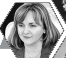
韦斯娜·普希奇 (克罗地亚前外长)