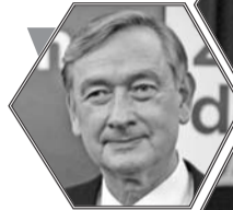
达尼洛·图尔克 (斯洛文尼亚前总统)