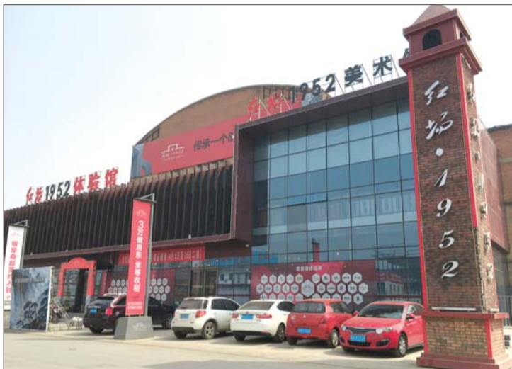
正在改造建设中的红场·1952项目。

10日,本报刊登了建设路上老厂房将变身JN150文化工场的消息,不少读者对这些老厂房很感兴趣。近几年来,越来越多的老厂房正在重现生机。腊山立交桥南500米处的济南市重点文化产业园红场·1952,将被打造成济南的“798”(即北京798厂改造的艺术区,已成为北京都市文化的新地标),目前项目西区主体钢架结构已经完工,东区原济南变压器厂的老厂房也在改造之中。园区内的大型商超、家居电商生活广场和文化创意产业园预计10月份营业。