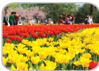
郁金香盛开的杨家河公园。