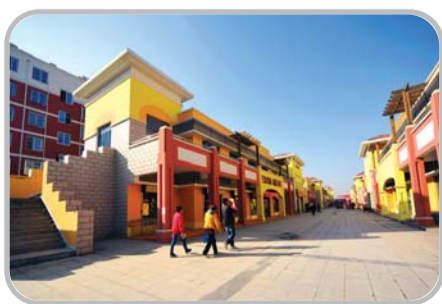
绿色家园社区商业街方便居民,带来商业活跃。