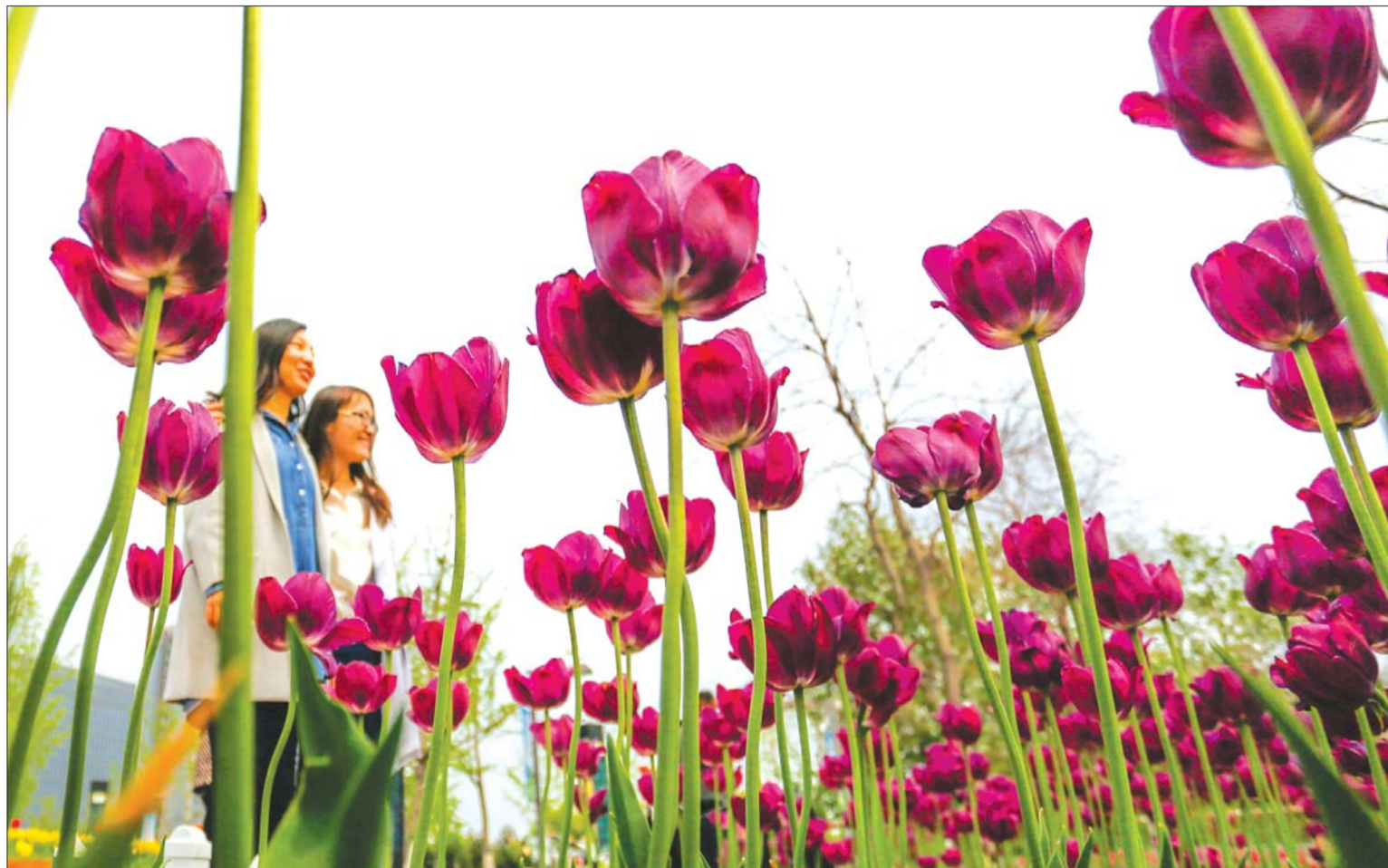
郁金香丛中美人更美。