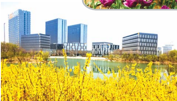
花丛掩映下的产学研基地。