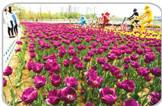
鲜花、绿道相互衬托。

夜幕降临，华灯初上，蓼河水畔静了下来。抬头而望，一座座办公楼上，不少的房间仍灯火辉煌，那是创业者们正用青春点燃梦想。正如这座科技新城，从未停下前进的步伐。