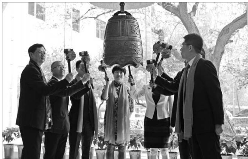
13日,8家济企组团到北京挂牌新三板。