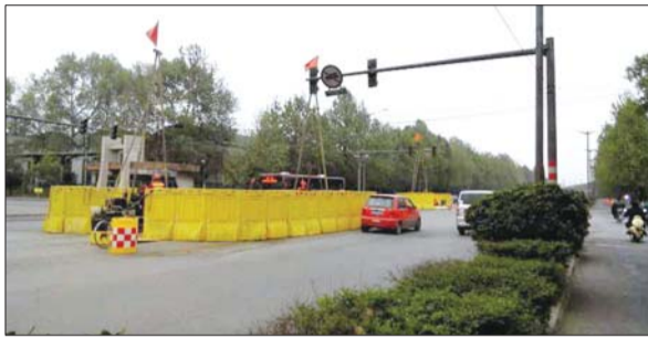
工业北路厂西路附近每隔一段路就在进行勘测。

工业北路快速路工程是济南市重点项目,记者从济南市市政公用局相关负责人处了解到,勘测已经基本完成。后续将进行环评、可行性研究、项目立项等工作,并争取在6月开工。开工后,工业北路