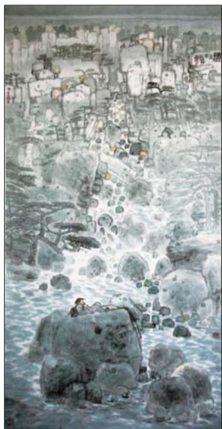
▲听玉 137×68cm 2015年 周石峰

对于画面中所呈现出的淡，周石峰认为“淡”意味着两层意思，一是指精神上的淡，一是指视觉上的淡，只有两种淡融在一起，才能产生空幻而有深意的淡境。精神上的淡主要是淡泊名利，最大限度的与之保持距离。视觉上的淡就是淡化物象，淡化点、线、面、墨、色之间的冲突，使之在有无