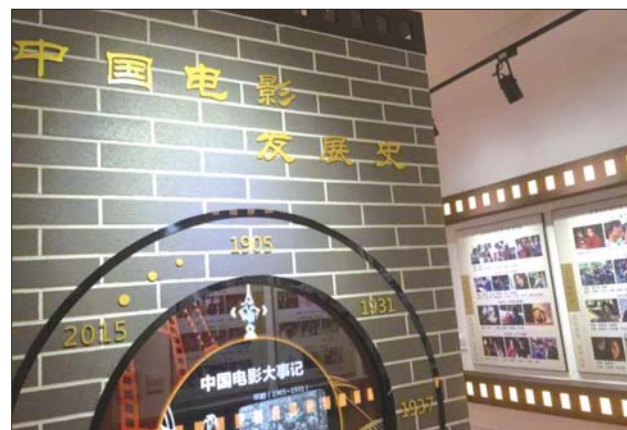
展示中国电影的发展历程是蝴蝶楼的一项重要内容。

蝴蝶楼二楼展室是中国第一位影后胡蝶当年居住过的客厅、卧室。胡蝶的表演生涯从上世纪20年代末持续到60年代。是上世纪三四十年代中国最优秀的演员之一。