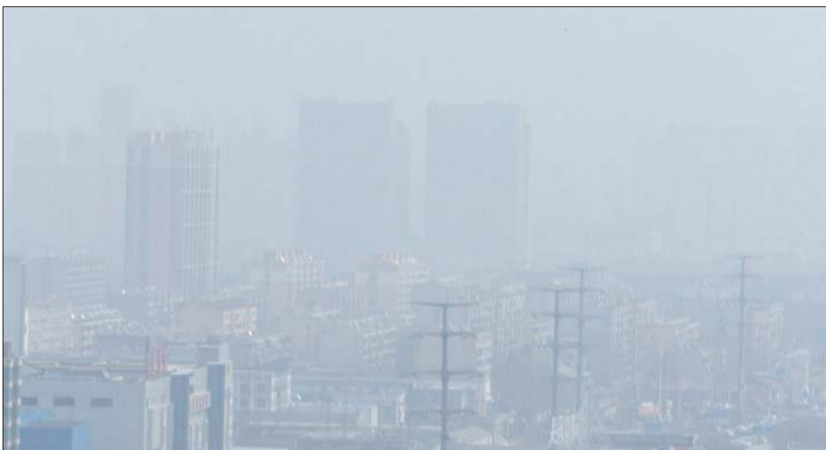
3月19日早晨起,济南市区出现严重雾霾。(资料片)

孟祥新分析说,霾日增加与空气质量下降有很大关系。“空气中的污染物增加了,大气清洁能力越来越差,大量污染物扩散不出去,从而导致霾日数量成倍增加。”