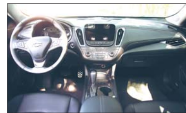
飞翼式双座舱搭配悬浮式中控台