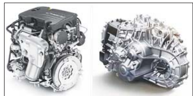
1.5T顶置直喷涡轮增压发动机