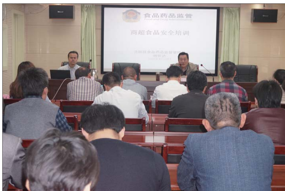
商超食品安全培训会。