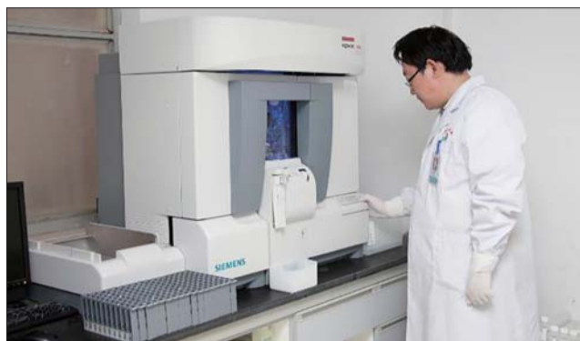
德国西门子全自动生化分析仪

检验科对许多人来说,是一个熟悉又陌生的科室。仅需几毫升血液标本,即可得到体现身体机能的各项指标数据,它是身体健康的晴雨表,也是医生诊断的好帮手。济阳县人民医院检验科,一个站在专业发展前沿、现代化、信息化的科室,一直发展进步,致力于提供最精确的检验报告,致力于更好、更快、更准确地为患者服务,同时也为临床工作的开展提供了坚实的基础。