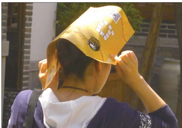
25日，济南市区太阳当头，气温高达28.5℃，很有些夏天的味道了。