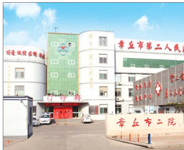
章丘市第二人民医院