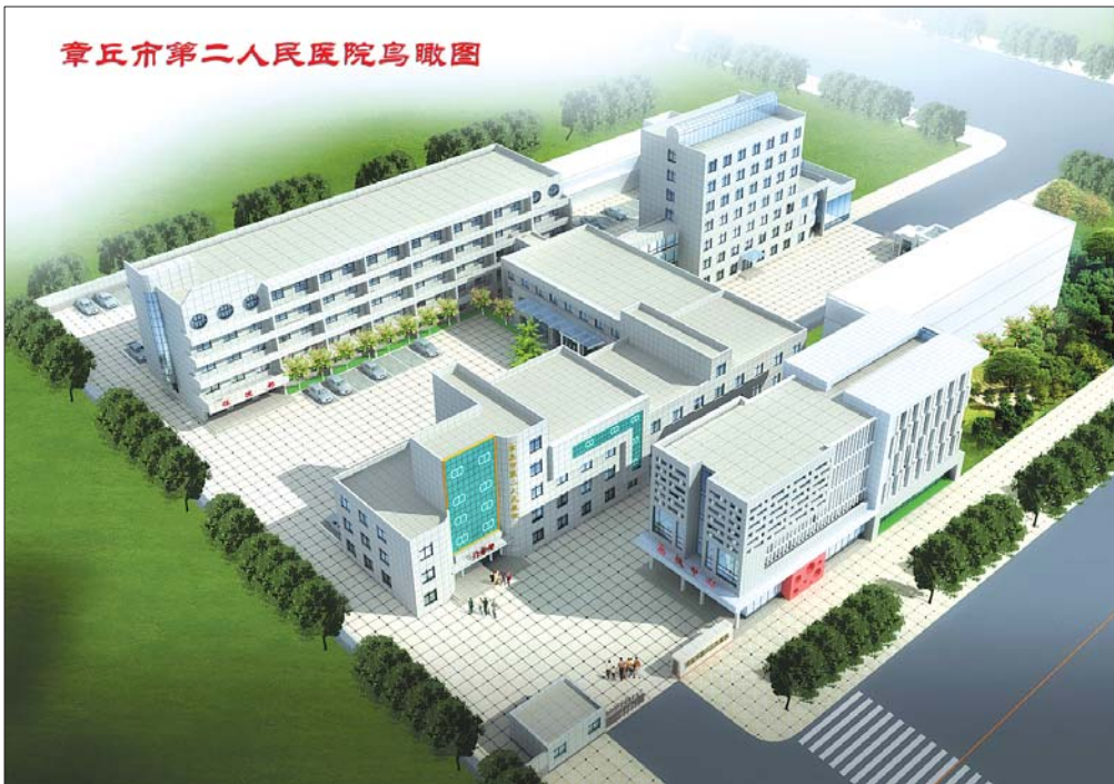
章丘市第二人民医院鸟瞰图

烧伤科,于 2010 年底被济南市卫生局批准成为章丘市明水烧伤整形医院。该科多年来根据烧伤治疗理论以及十余味中草药研制出了烧伤创面外用药膏-烧伤灵 I 号。该药膏可治疗大面积烧伤、化学灼伤、外伤性溃疡、各种放射性溃疡等,创面愈合快瘢痕少,已成功救治烧烫伤病人 10 万余人。