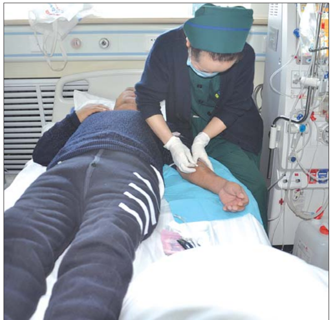
血液净化中心:内瘘穿刺