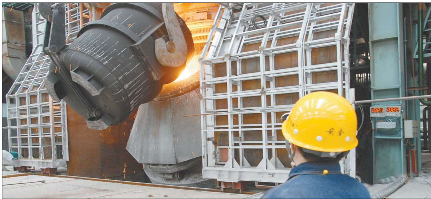
年后,泰钢不锈钢炼钢厂的车间一直很忙碌。

3月份以来,多个宏观经济数据好于预期,市场对经济回暖、复苏甚至反转的预期普遍升温。数据背后,房地产小阳春,外贸数据“撑竿跳”,大宗商品现暴涨潮,各行业都在释放暖流,实体经济向好的信号一再得到确认。显然,眼下的经济没有某些人年初预言的那么悲观,但到底已运行到哪个位置,不妨深入调查一线企业,感知经济的温度。