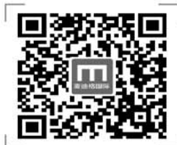
扫描二维码报名 看最新科技动态

虽然活动在上周已经结束，但由于报名火爆，我们将继续为小读者提供免费的试戴活动，没报上名的小读者家庭即日起可继续通过拨打热线400-658-6616报名，仅限30名。