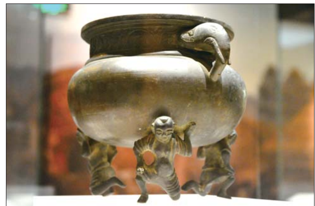
◀造型精湛的象耳人形足铜炉。

雅集免费体验活动将于5月4日14:00—15:30,在济宁市博物馆一楼的沉香雅集展厅举行。内容不仅包括沉香基础知识介绍、香道专业器具的展示,还有工作人员表演香道仪轨流程,观众更可以切实品味到优雅纯正的沉香。