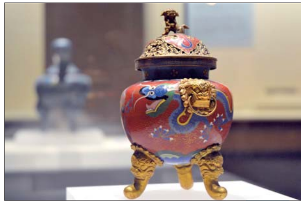
▲纹饰华美的乾隆款珐琅凤眼耳炉。

届时,主办方还特意为广大游客、济宁市民准备了趣味盎然的“一起来‘陶’吧”互动活动,游客、市民不仅可以在陶艺老师的指导下亲自动手制作陶艺,还能在烧制好的陶器上发挥想象力,绘出你喜欢的纹饰。