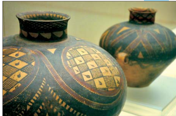
▲古朴的四大圈网点涡纹彩陶瓮。