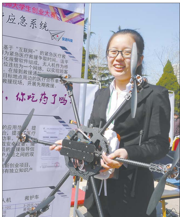
大学生创业热情很高,近日,山东师范大学举行大学生创业大赛,一在校生展示自己小组独创的无人机医疗应急系统。

今年,将选2所学科特点突出、基础条件较好的科研院所先行试点。4月底前,制定统筹推进“双一流”建设总体方案,6月底前制定科研院所与高等学校资源整合试点方案。