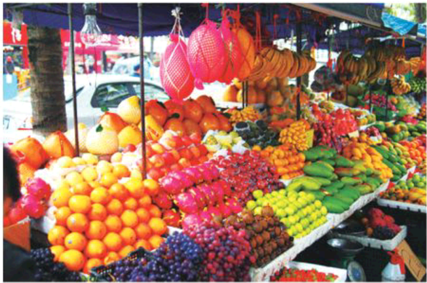
五指山随处可见的果蔬一条街