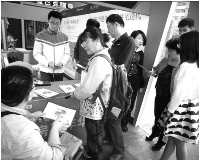
14日,齐鲁晚报2016春季购房嘉年华在万达广场拉开帷幕,许多市民闻讯前来。

实惠。”市民袁先生和妻子一直想换个三居室房子,在房价稳中上涨的市场环境下,这种真金白银的折扣给他们带来很大的实惠。活动现场,改善型产品也是主力,济南的东、西、南、北区域全部覆盖,可以全面准确了解市场情况,综合对比选择性价比最高的产品。 此外,主办方特设晚报免费送回馈泉城读者活动,展会两天每日前200名预约观展到访者可获得惊喜礼品一份。活动现场的齐鲁楼市购房俱乐部也吸引了广大市民的关注,大家买房时遇到的难题、置业该注意的事项等,都在这里得到了满意的答复。市民可以继续拨打预约参与咨询电话:0531—85196595、85196379。