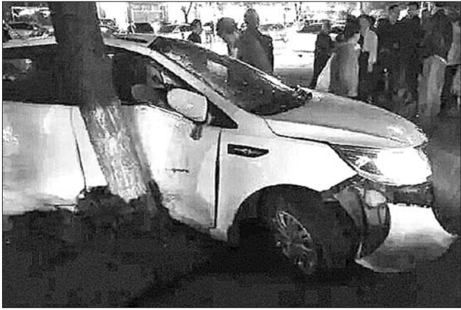
轿车被顶到树上才停下。 视频截图

14日，记者在事发现场看到，道路西侧有一棵树被撞歪，事发时轿车被公交车顶着挤在树上，才停了下来。而路东侧的路沿石下方有一大片血迹。青州市公安局微信公号已对此事进行简单说明：“5月13日19时15分，青州市公安局110接到报警称，青州市云门山路发生一起公交车撞击轿车事件。经初步调查，该事件是一起刑事案件。目前，该公交车司机已被依法控制，受伤轿车司机正在接受救治，无其他人员伤亡。”