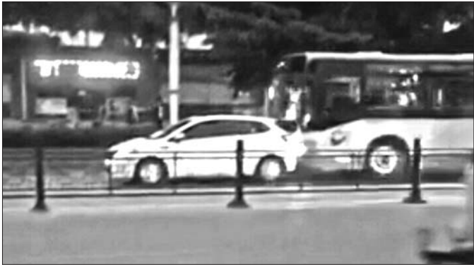
事发时，公交车顶着轿车往前走。 视频截图