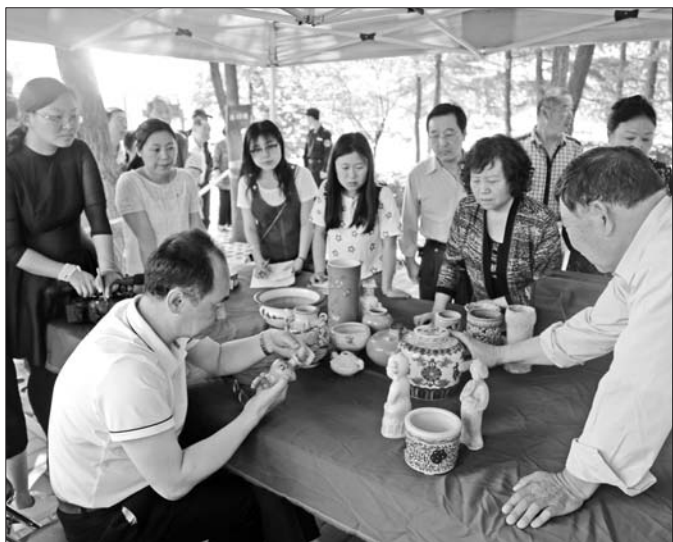
专家正现场给市民鉴定文物。

据悉,贡秋也被戛纳组委会安排了走红毯,戛纳的活动结束后,她将随导演金华青赶赴伦敦,参加伦敦华语影像艺术节。该电影节在伦敦大学国王学院和英国电影学会南岸中心举行,《贡秋卓玛》幸运地入围纪录片主竞赛单元,并有角逐“最佳影片”的机会。