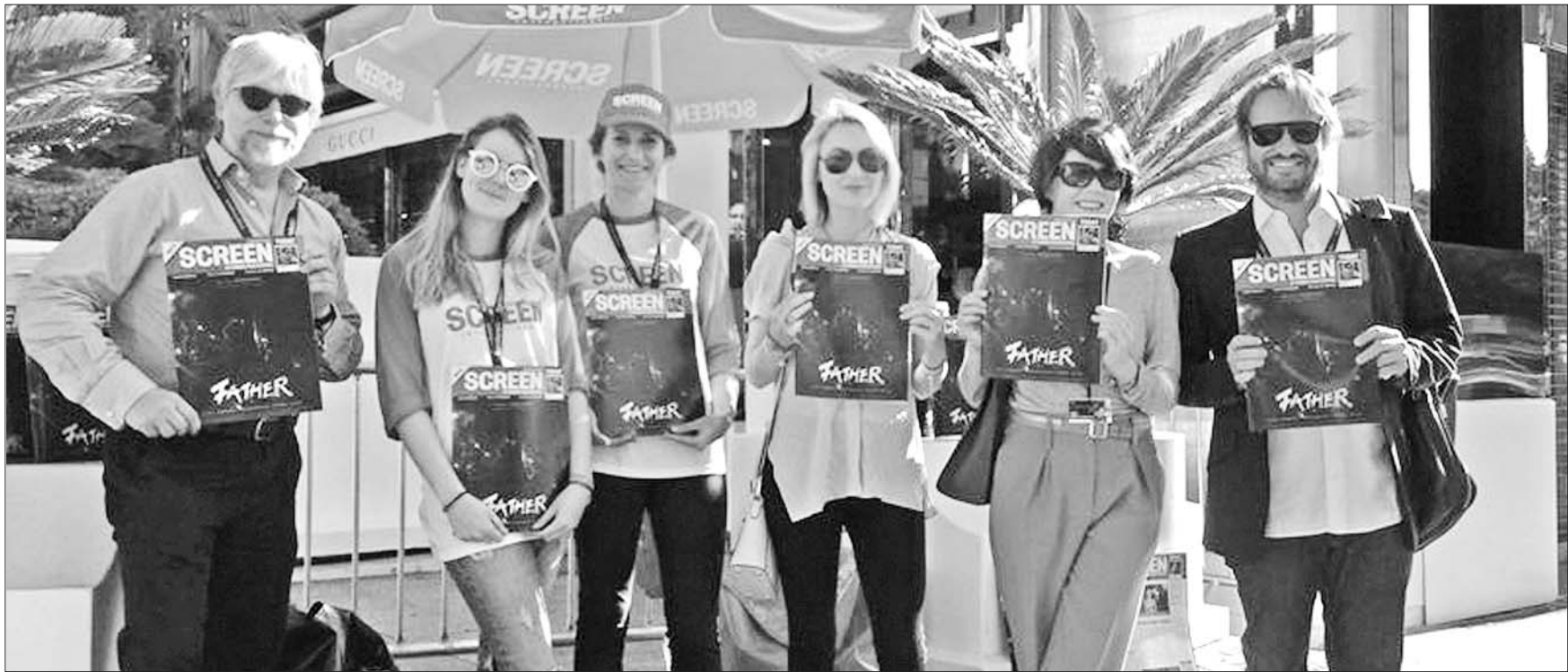
王学圻首次担纲商业片导演的电影《以父之名》登《Screen》戛纳电影节场刊封面。