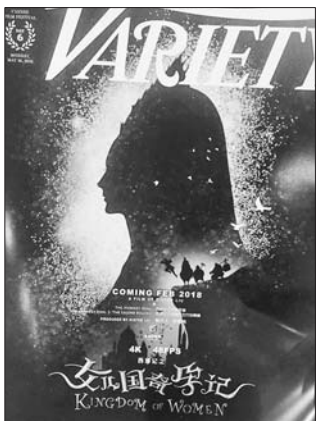
《记忆大师》登2016戛纳首日场刊封面。