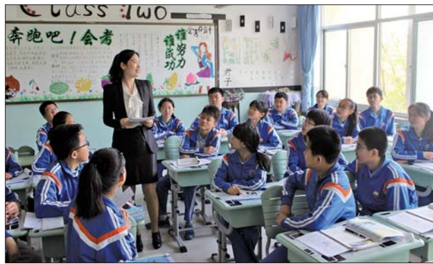
▲特色阅读教学,打造书香课堂。