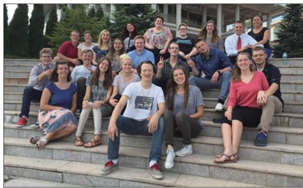
▲ILP外语教学,学习英语“ So easy ”。