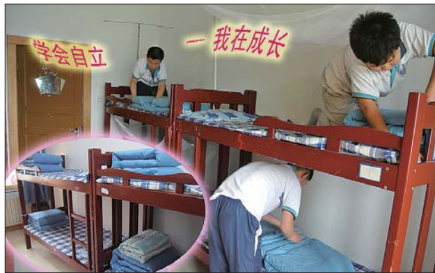
▲学生正在打扫宿舍。