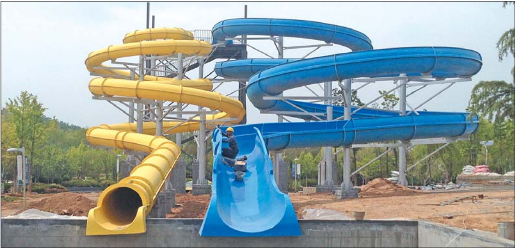
大回环滑梯主体已搭建完成。

本报5月19日讯(记者 张帅) 随着济南国际园博园(以下简称“园博园”)景区内的金港湾游乐园项目施工日渐进入尾声,长清即将拥有自己的大型游乐场,今后市民不用再出远门,在家门口就能玩到爽,想想也是美美哒。19日上午,记者从园博园管景区委会获悉,目前游乐园各项目施工进展顺利,水上项目计划于7月1日起试运营,陆上项目也将在今年国庆节期间对外开放。