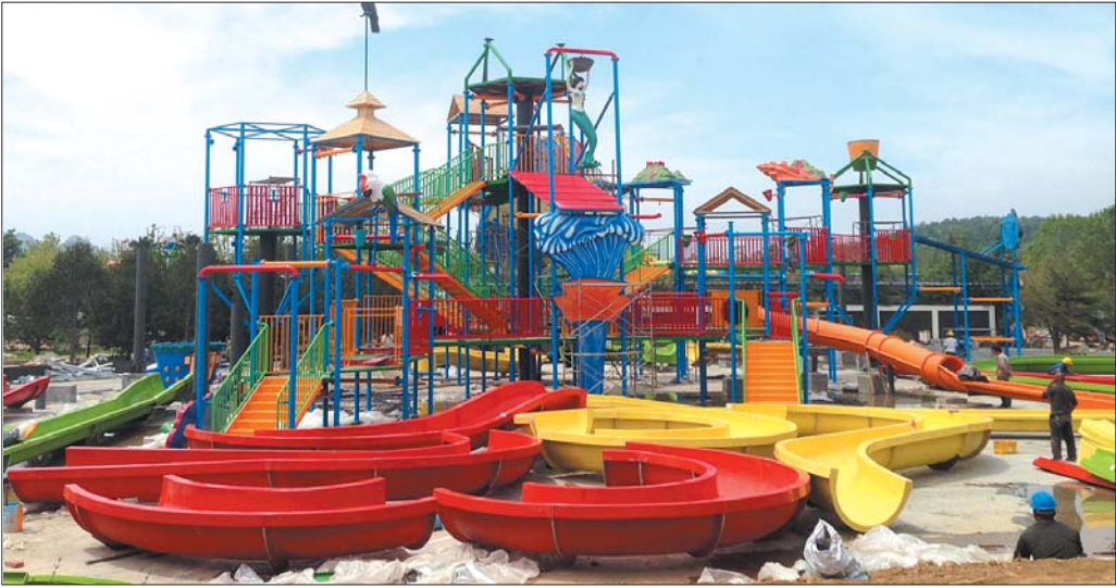
金港湾游乐园水上项目施工已接近尾声。