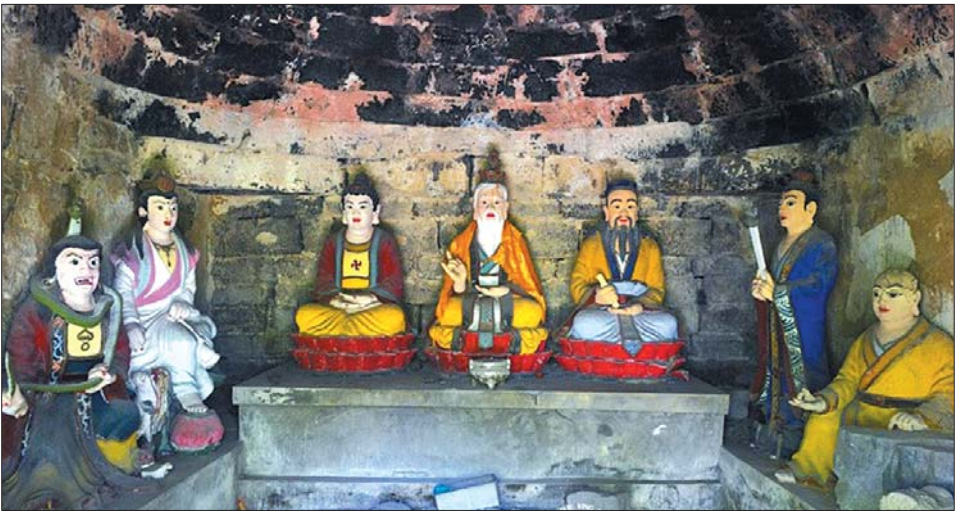
三教堂内多教合一,众神齐厅,由此可见,和谐共处的理念是永恒主题。

由岚峪北山下来,重新走进岚峪村,就在村口不远处的道东位置,有一方长碑竖立在路边。石碑高约两米半,宽有80厘米,碑的上方为两条粗壮的飞龙缠绕在一起,张开的龙嘴做戏珠样,飞龙下方的中间题有“圣旨”二字,不同别处的分体竖碑,这方石碑头身为一块巨石做成。石碑的下方刻有“金石其心”四个大字,右边依稀可以辨出“品顶戴山东巡抚”等文,左边只可以看到“大清光绪”字样,其他的历史内容就实在难以辨识了。听附近的村民查光国介绍,这块石碑是光绪皇帝为本村一位守节的妇女题写的。石碑原先在稍东的地方平躺着,上面堆有玉米秸,不知什么原因烧起了大火,这方石碑的中间被大火烧得脱了一层“皮”,好多字迹就因为这场大火再也看不到了,后来村民齐心协力将石碑扶起放正保护起来。至于当时守节的这位妇女姓什么,为什么竟能惊动皇帝,就实在没人说得清了。