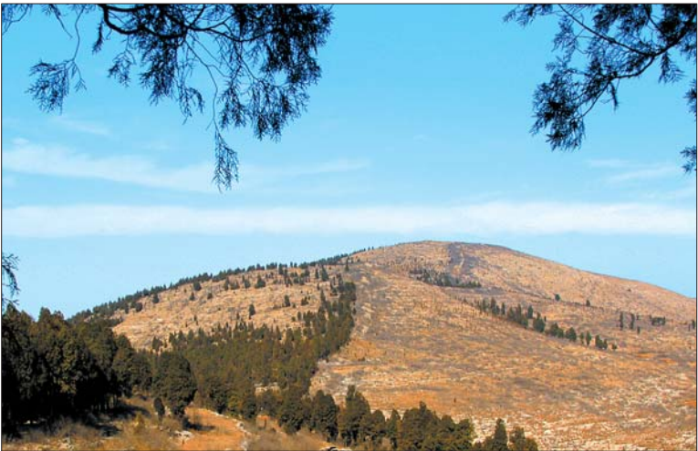
◀ 齐长城岚峪北山段。