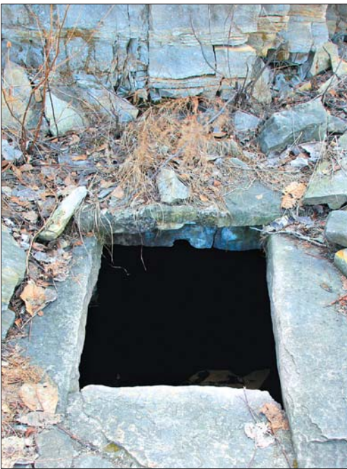
“梦井”大泉其貌不扬,却滋养了世世代代的岚峪乡民。