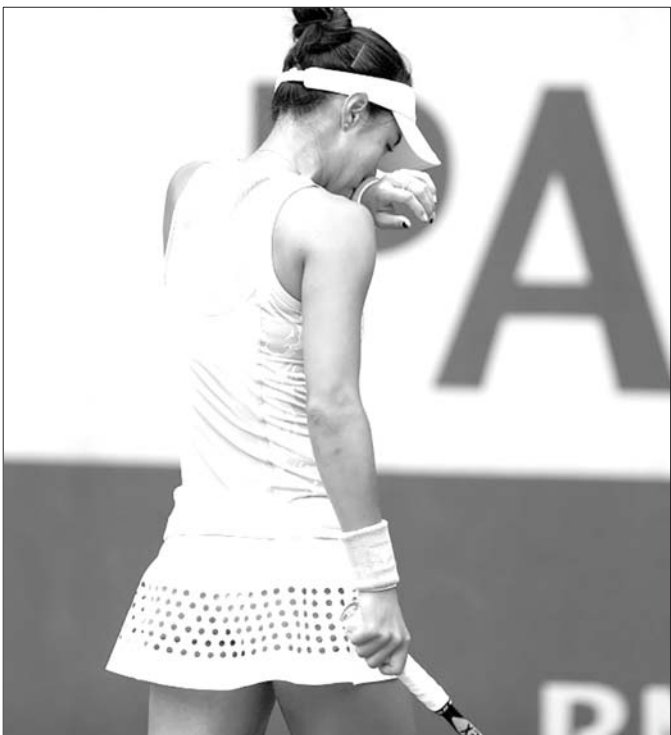
王蔷止步法网女单首轮,中国金花单打全军覆没。