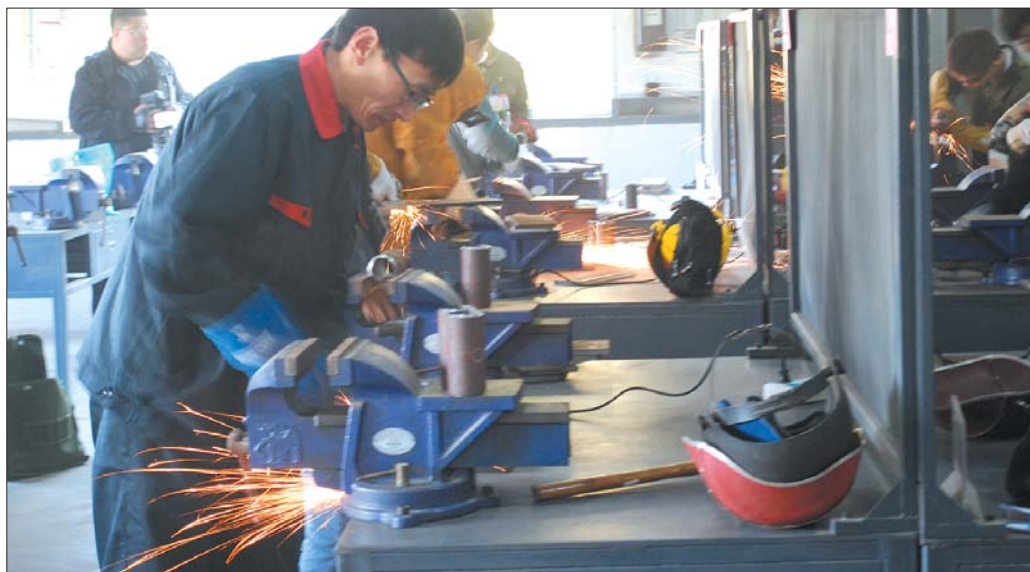
▶长清职专学生参加市焊工技能大赛。

长清区职业中专是省级重点职业中专，济南市重点扶持的职业学校，长清区唯一一所国办职业学校。学校坚持以促进人的全面发展、持续发展、快乐成长、幸福生活为宗旨，坚持以市场为依托，以就业为导向，以技能为核心，以改革为动力，以管理为抓手，努力提高管理效能，提高教学质量，提高就业质量，促进教师的健康、快乐和幸福。