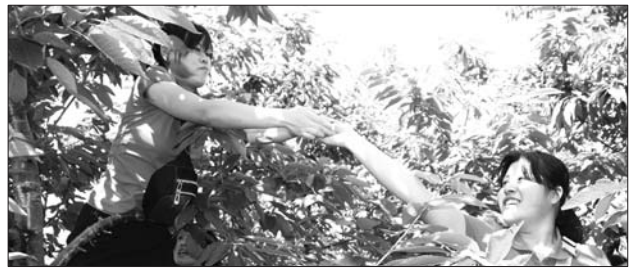
随着烟台大樱桃成熟,大樱桃采摘游又火了起来。

生产类书籍供渔民在龙口、桑岛边防海疆书屋阅读、学习,同时,渔民还可利用书屋内互联网电脑开展“微商”,将身边的干货、水果放到网上销售,拓展休渔期收入。边防民警还通过建立微信群,做强“休渔服务+”,延伸休渔期间的渔船民服务,定期将天气资讯、休渔政策内容、海疆书屋书籍目录等内容发送到群内,方便渔民查看。