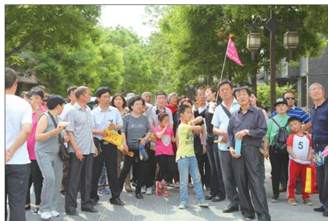
外地旅游团古城参观。

游团队,共接到698名团队收费游客;5月份,古城迎来14个旅游团队,共计接待308名团队收费游客。这些旅游团队主要来自菏泽、濮阳、济南、济宁、烟台、邢台、北京等地。 随着古城景点开发项目的逐渐完工,以及各项配套设施的逐步完善,中华水上古城作为国内独具特色旅游景区的优势逐渐凸显,中华水上古城相关团队也在按照既定的目标,逐步推进市场开发、市场调研、导游员培训,同时在古城建设时期,保证各开放景点正常开馆。