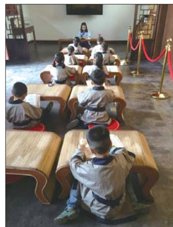
经典诵读。

记者了解到,七贤祠国学公益课堂设在七贤祠后院的孔子学堂,由中华水上古城和聊城鲁韵国学(原蒙正学堂)联合开办,共开设国学诵读、德行礼仪、武术、围棋、古筝等课程,学制为半年,其中国学诵读、德行礼仪、武术全部课程免费,围棋、古筝等特色课程推出免费体验课,每周末面向全市小学生开设。