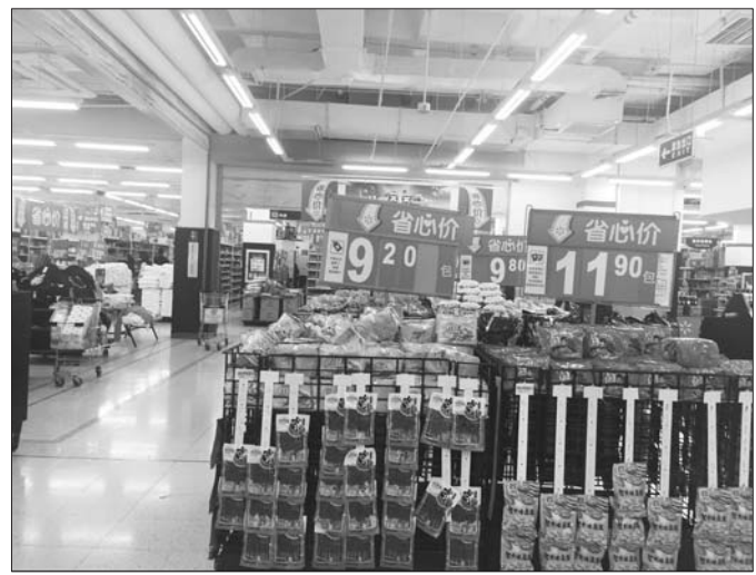
6月15日,沃尔玛将撤离烟台,超市内不少东西在打折促销。

相对本土商超,洋超市对外界的反应和变化速度有些慢,常常沉浸在国际一流大超市的温床里,对当地的法律法规、职业打假政策不了解,一出事也没有能积极应对的公关部门。 本报记者 秦雪丽