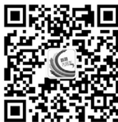
齐鲁晚报健康快车