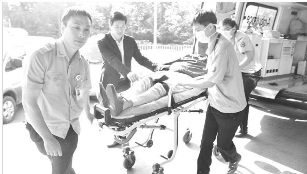
他们,是救死扶伤的“急救先锋”。

本报济宁6月6日讯(记者李倩 康宇 通讯员 田长美) 即日起,本报联合济宁市卫生急救指挥中心推出“最美120窗口”创建、“最美急救先锋”推荐公益活动。通过创建评选,让更多人了解、关注这个群体。